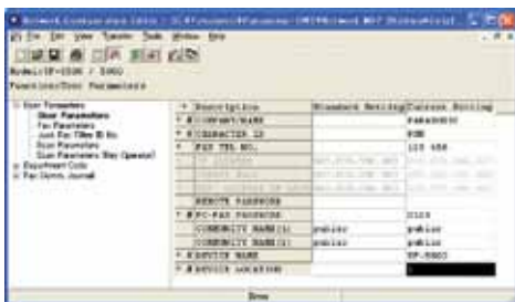
Telefonbuch und Konfiguration

Das angewinkelte und großflächige Bedienfeld verbessert die Anzeige und erleichtert den Betrieb. Von der Anordnung der "Direktwahl"-Tasten bis zum leicht ablesbaren LCD-Display mit 32 Zeichen wurde alles darauf ausgerichtet, Ihren natürlichen Workflow zu unterstützen.