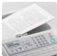
Automatischer Dokumenteneinzug mit hoher Kapazität

*Nur UF-5600. UF-4600: 4 Sekunden pro Seite